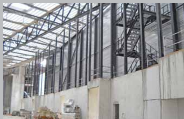
Facciata sud interna