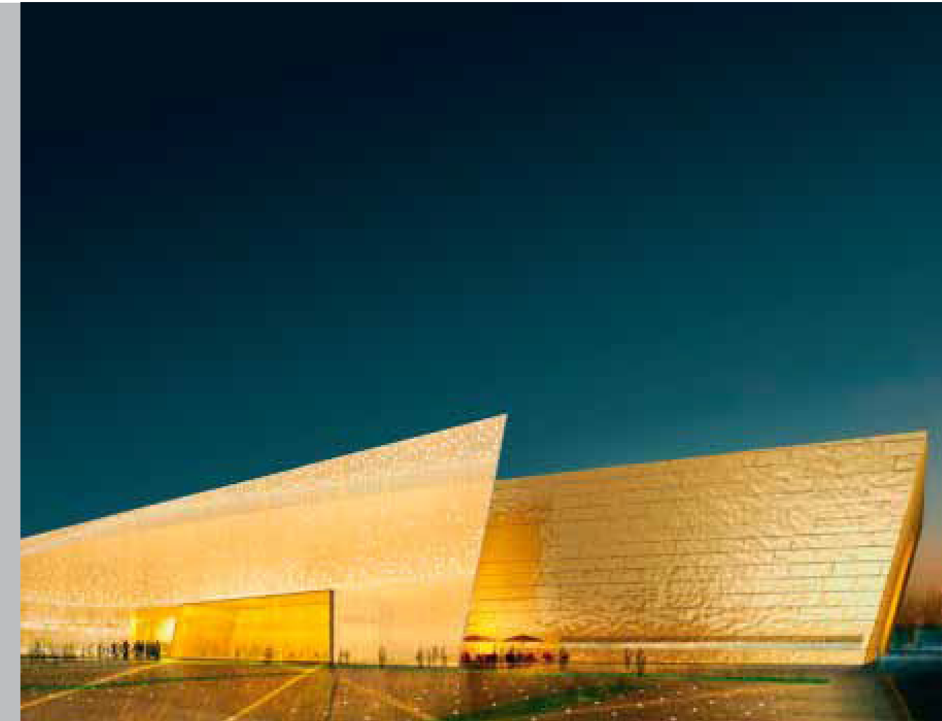
Parco Fieristico di Châlons en Champagne